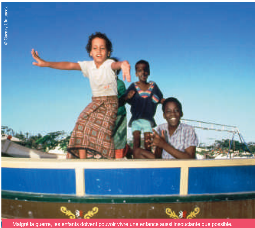
Malgré la guerre, les enfants doivent pouvoir vivre une enfance aussi insouciante que possible.

SOS Villages d'Enfants fournit une aide dans 132 pays, dont beaucoup sont pris dans les rets de conflits internes ou externes. La Somalie est l'un de ces pays où l'organisation travaille malgré la guerre et l'anarchie. Au risque de leur vie, les collaborateurs de SOS Villages d'Enfants s'engagent en faveur des enfants orphelins et de la population afin d'atténuer leur misère.