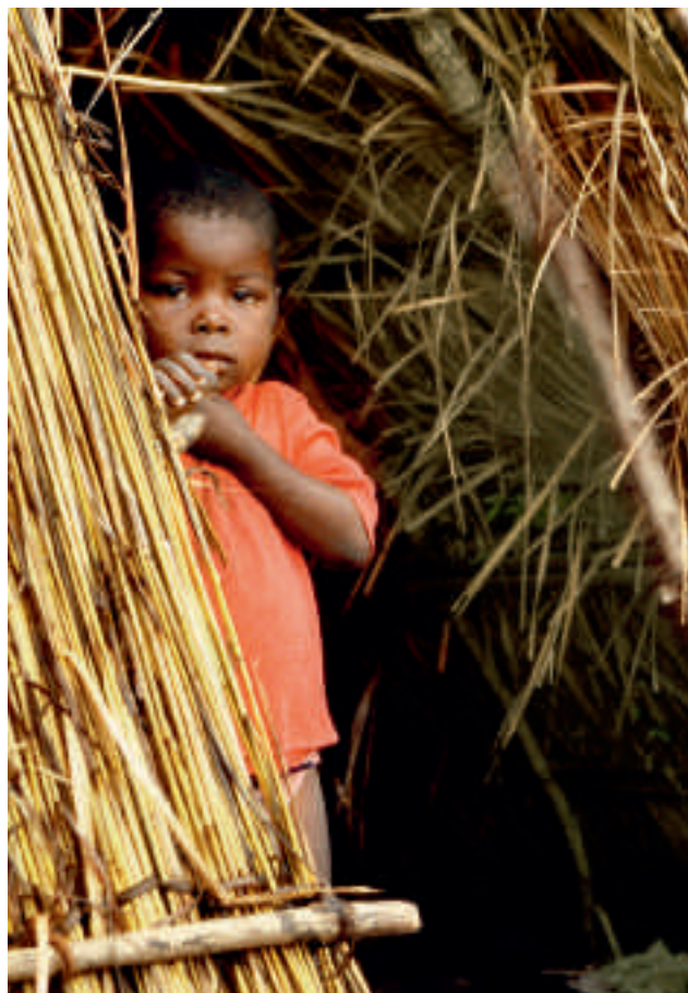
Les cabanes du camps de réfugiés du Congo offrent un pauvre refuge