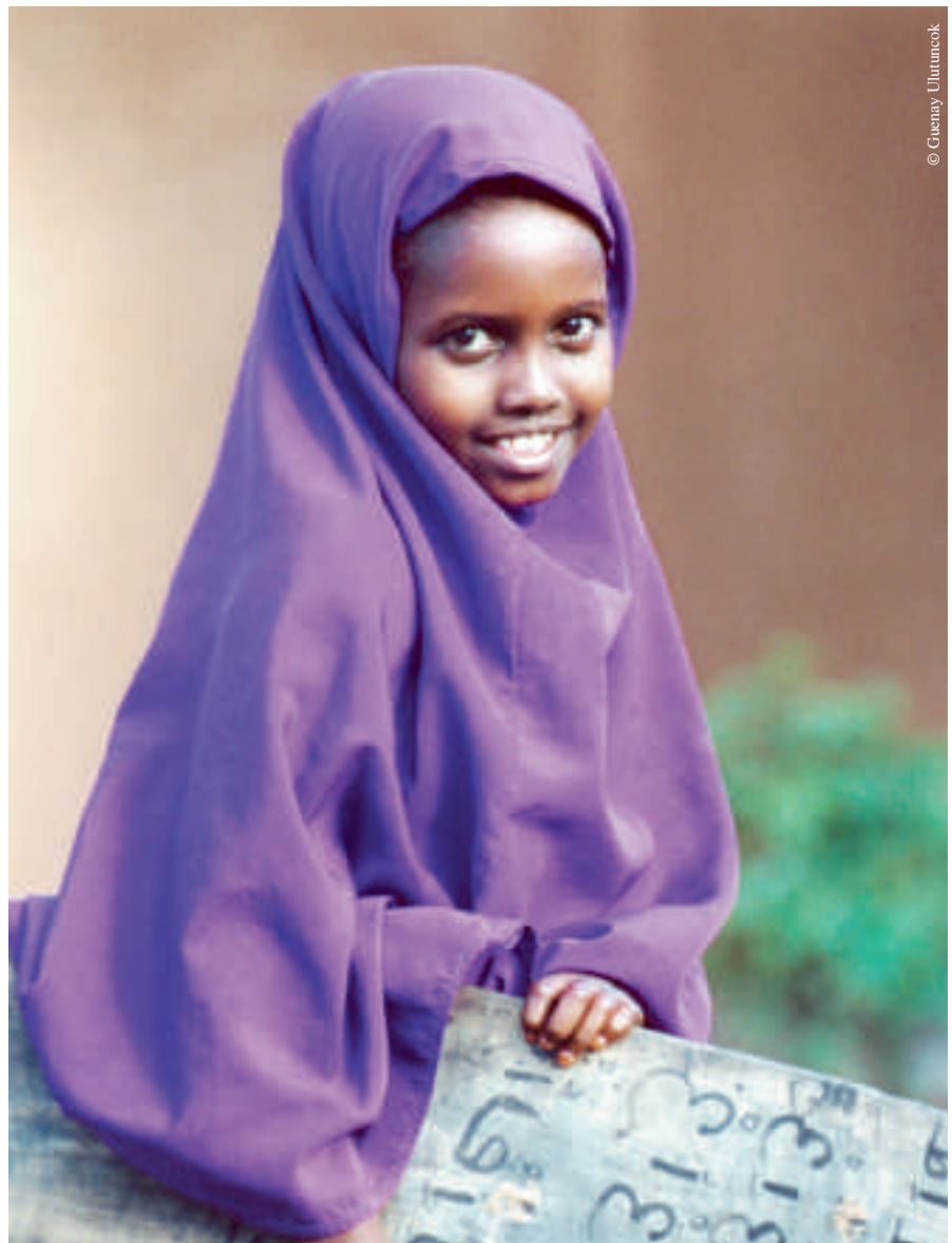
Quand c'est possible, les écoles des villages d'enfants SOS restent ouvertes.

plus durs de la guerre civile, quand toutes les représentations diplomatiques avaient quitté le pays, les collaborateurs de SOS Villages d'Enfants ont fait tourner l'organisation. Ils ont connu à plusieurs reprises des situations dangereuses, voire mortelles, au cours des dernières années. La population locale leur a tendu une main protectrice, protestant contre les attaques de violence par des manifestations publiques.