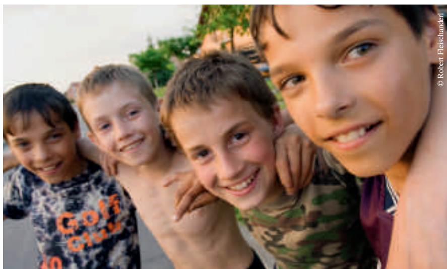
La vie quotidienne du village d'enfants SOS de Borovljany redonne de normalité aux malades du cancer.

Dans les 20 années qui ont suivi la catastrophe, le nombre des cancers de la thyroïde a été multiplié par 87 chez les enfants, par douze chez les adolescents et par cinq chez les adultes.