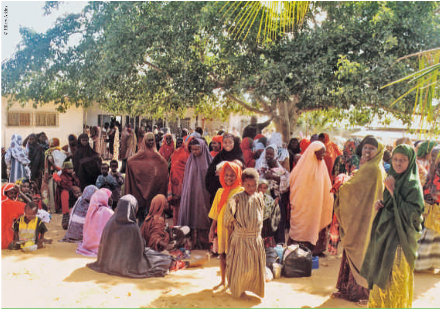
La file est toujours longue devant la clinique mère-enfant SOS.