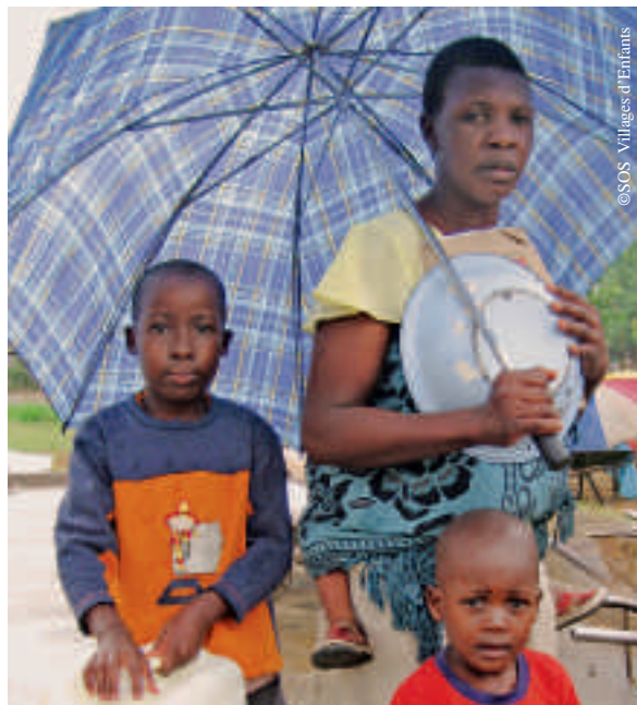
Les jerrycans d'eau aident à conserver la propreté de l'eau potable.

Les trois villages d'enfants SOS du Zimbabwe se trouvent dans des régions frappées par le choléra. Les infirmières ont informé les mamans SOS et les enfants sur les risques d'infection. L'eau est donc systématiquement bouillie ou désinfectée chimiquement. Si des enfants des villages d'enfants SOS devaient tomber malade, leurs soins médicaux seraient assurés. Grâce à la prise de conscience et au travail de prévention intense, aucun habitant d'un village d'enfants SOS n'a encore attrapé le choléra. La situation est moins bonne à Budiriro, une localité