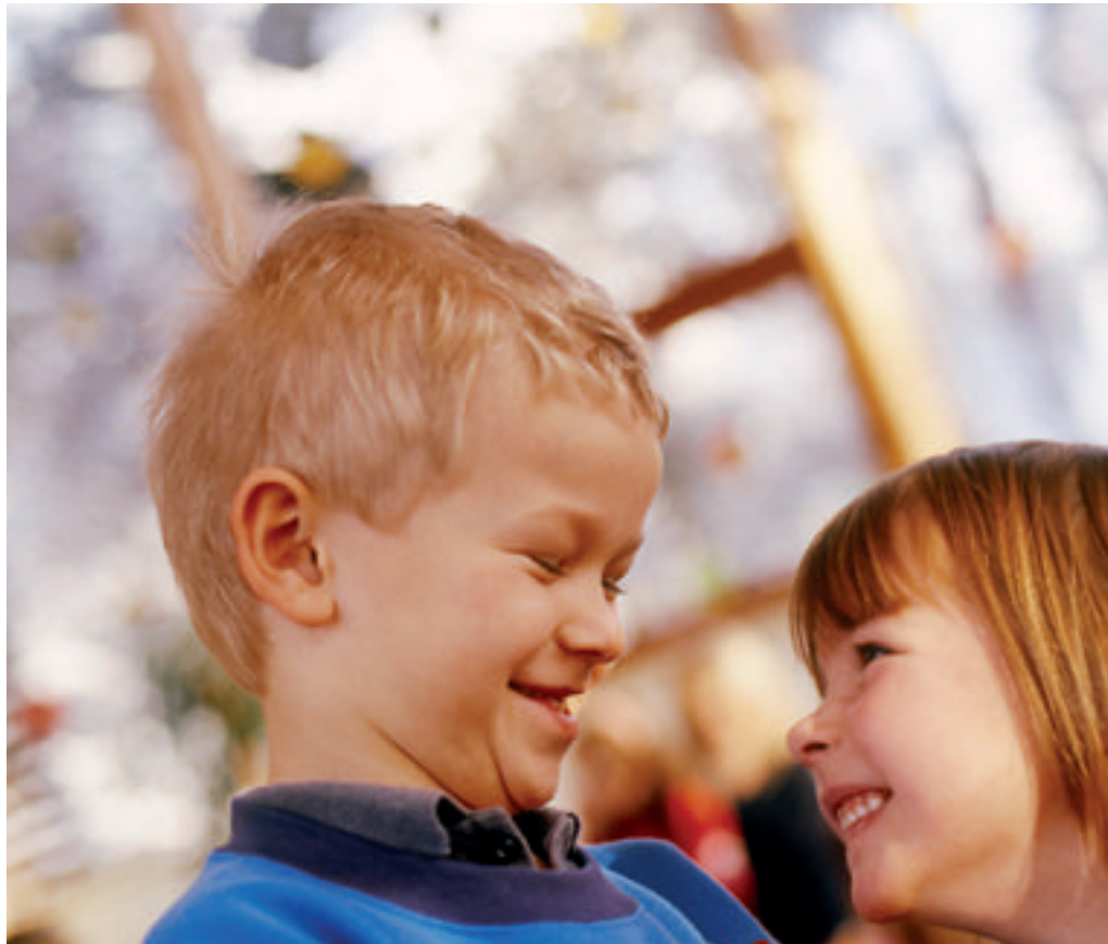
Le but de SOS Villages d’Enfants est que les orphelins sociaux puissent vivre une enfance heureuse

En 1953, Hermann Gmeiner a amené une kyrielle de journalistes à Imst pour les familiariser avec la philosophie de SOS Villages d’Enfants. Ils y sont restés quelques jours, ont examiné les choses de près, ont parlé avec les mamans SOS et les enfants. Le village s’est transformé en une véritable ruche, selon Theresia Neubauer, qui raconte comment les enfants s’étaient entassés dans les escaliers menant aux chambres à coucher, barrant la route aux journalistes: «Mes enfants ont maintenant besoin de calme!», a-t-elle ordonné aux hommes. Le succès du séjour des journalistes a été per-